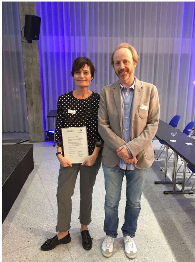
Abb. 1 ▲ Gewinner des „Clinical Poster-Price“ am letztjährigen Kongress zum Thema „Chronic Pelvic Pain“

In zwei Jahren planen wir einen Kongress zusammen mit der zweiten grossen Schmerzgesellschaft in der Schweiz, der SSIIPM (Swiss Society for Interventional Pain Medicine) sowie der Schweizerischen Kopfwehgesellschaft. Nicht nur gibt es bereits jetzt eine grosse Überlappung von Mitgliedern in beiden Gesellschaften, sondern beide Gesellschaften haben in der Vergangenheit viel Aufbauarbeit und Kontinuität geleistet in Bezug auf Ausbildung ihrer Mitglie-